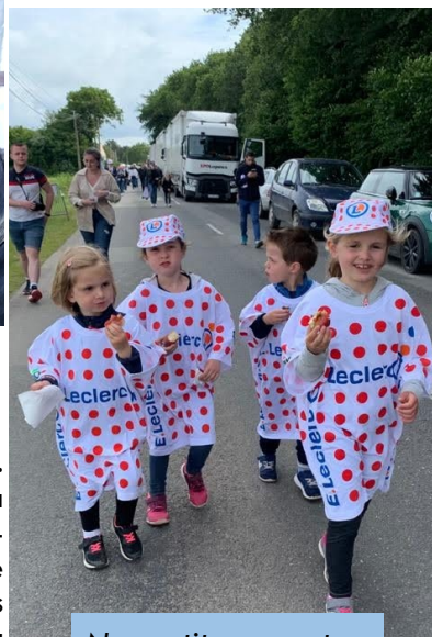
Nos petits supporters Pencranais