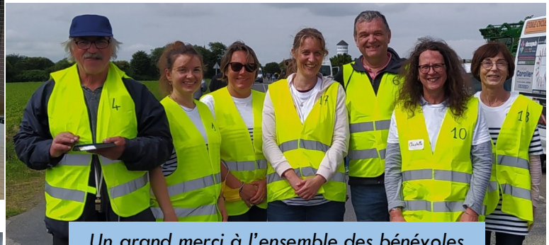
Un grand merci à l'ensemble des bénévoles

Finalement l'affluence n'aura pas été aussi importante que prévu mais le service aura été assuré impeccablement. La Municipalité remercie tous les intervenants. À 21h, la route était ouverte à nouveau et les riverains retrouvaient un peu de calme après une folle semaine. Les encouragements peints sur la route menant à Pencran nous rappelleront encore durant quelques semaines cette journée extraordinaire.